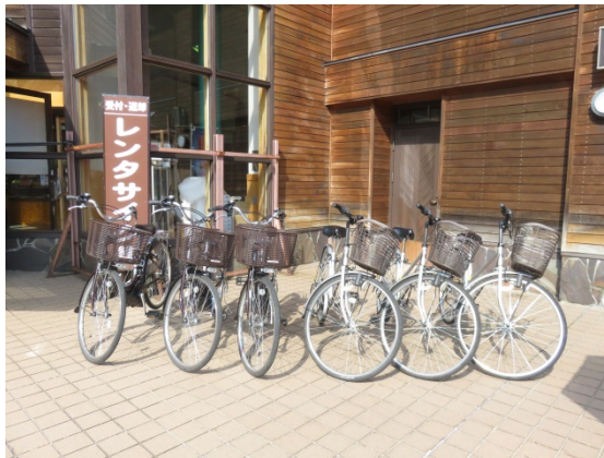
▼ 奥入瀬渓流館のレンタサイクル